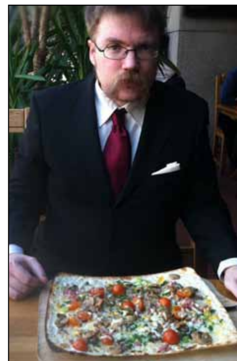
Kuvassa pohjoissaksalainen "Flammkuche" -annos.

Palatessamme jälleen kongressikeskukselta, yllätti pahemmanpuoleinen jano. Jo edelliseltä päivältä tutuksi käynyt Hofbräu oli oikeassa paikassa oikealla hetkellä. Nyt päätimme kokeilla perinteikkäitä litran baijerilaisia tuoppeja, saksalaisittain nimellä "Mass" tai "Wiesen-Mass" tunnettuja. Totesimme tumman vehnäoluen, ns. Dunkles-Weissen , maltaisen vehnäiseksi, raikkaaksi ja vähähedelmäiseksi, vienosti paahteiseksi. Helles puolestaan oli nimensä mukaisesti varsin vaivattomasti juotavaa, kirkasta ja suutuntumaltaan Paulanerin vastaavaa hieman pehmeämpää. Molemmissa oluissa oli tunnistettavissa selvä baijerilainen vivahde.