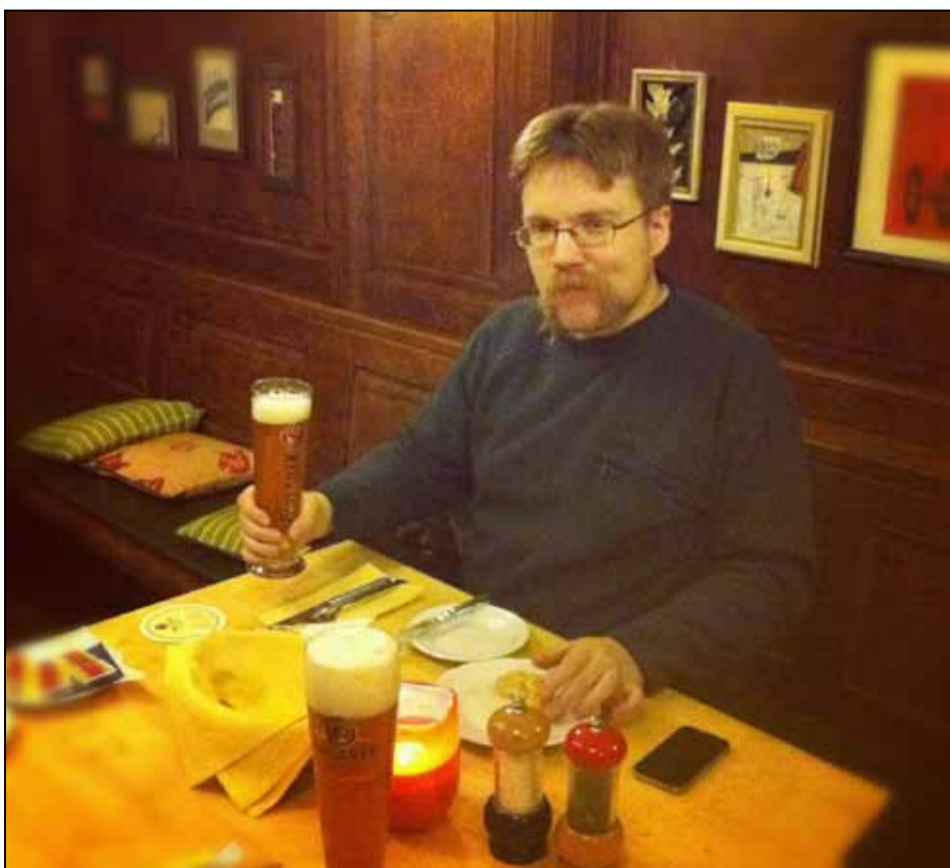
HEIMATSTIL. Baijerilainen talonpoikaishenki vaikutti Paulanerin Miraculumissa.