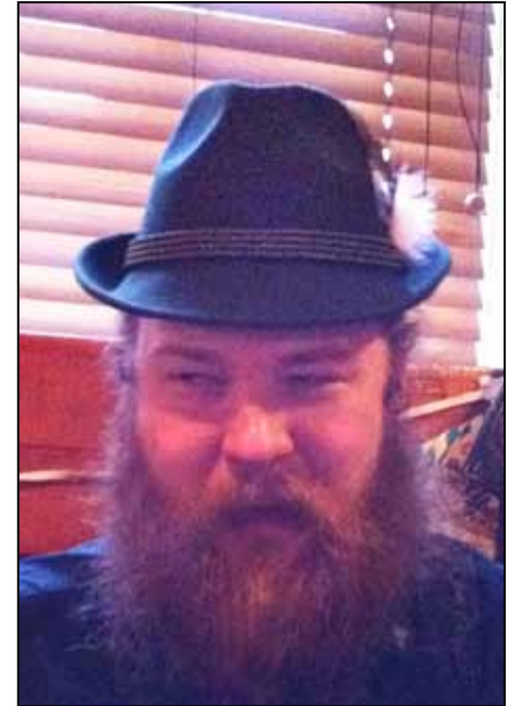
Tyypillisin tirolilaishatun malli. Kuvan hattu hankittu Innsbruckista.

Alkuperäisestä tirolilaishatusta on aikojen saatossa syntynyt useita paikallisia ja ajallisia variaatioita. Näistä varmaankin tunnetuin on ns. Berghut , vuoristohattu. Muotoilultaan se on lähes täysin identtinen tirolilaishatun kanssa, ainoana erotuksena useimmiten kokoharmaa väritys ja tyypillisesti paksu, Baijerin sinivalkoisissa väreissä hatun kruunua kiertävä punosnaru. Edelleen variantti tästä on Oktoberfestiin vahvasti assosioituvaa ”vilttihattu”, Filzhut . Tämä jokseenkin koominen hattumalli on yleensä harmaasta huopakankaasta valmistettu ja omaa poikkeuksellisen korkean, keilamaisen kruunun, jota vuoristohatun tapaan ympäröi baijerilaisnaru. Vilttihatun lieri on tyypillisesti suora ja suhteettoman leveä. Noita- ja taikurihahmojen kliseistä pähinettä muistuttavalla vilttihatulla ei juuri ole käyttöä Oktoberfestin ja vastaavien kansanjuhlien ulkopuolella. Se mielle-täänkin yleisesti nimenomaan karnevaali- ja huumoripähineeksi eikä siihen suhtauduta kovin vakavasti.